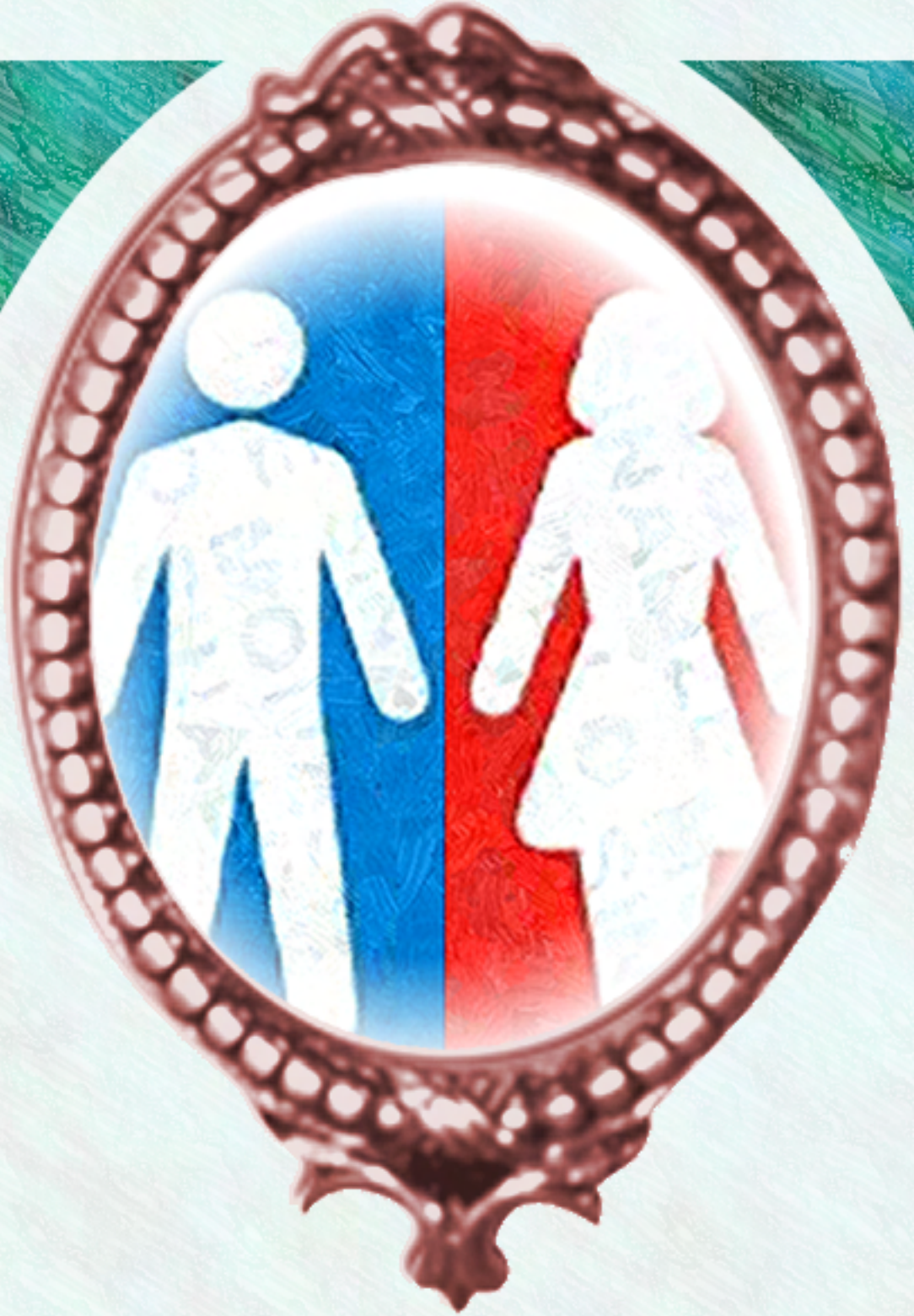
TROCAR O SEXO DO PERSONAGEM