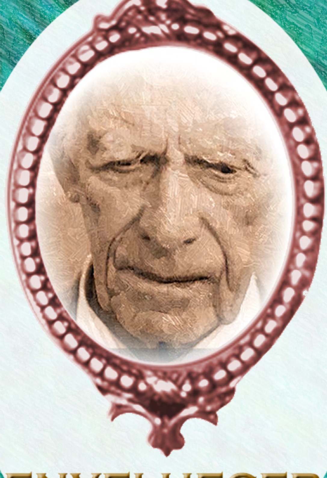
ENVELHECER O PERSONAGEM