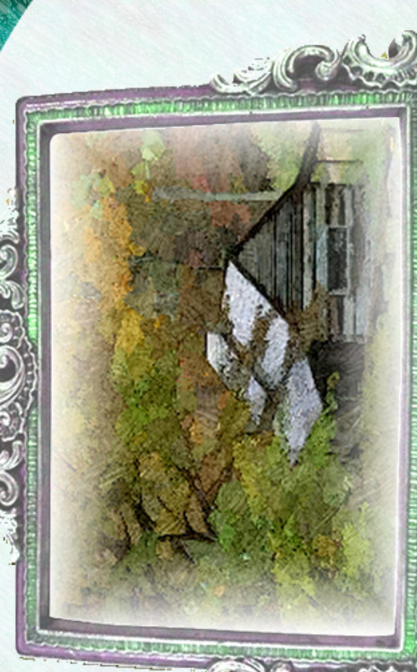
CABANA NA FLORESTA